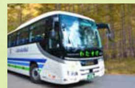
低公害ハイブリッドバス

ただし運行は例年4月から11月まで。本数も少ないので、最終バスに乗り遅れてしまわないようご注意ください。